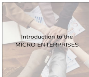
Introduction to the MICRO ENTERPRISES