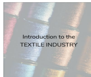
Introduction to the TEXTILE INDUSTRY