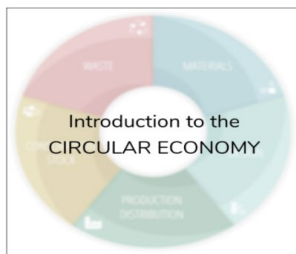
Introduction to the CIRCULAR ECONOMY